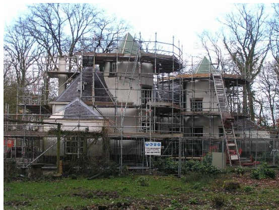
Herfst 2020: poortgebouw in de steigers

gedaan: nieuwe leien op het dak, zinkwerk vervangen, alles geschilderd en vloeren-gevels-daken geïsoleerd. In het voorjaar van 2021 zijn de werkzaamheden opgeleverd en sindsdien worden de twee knusse woningen in het pand verhuurd.