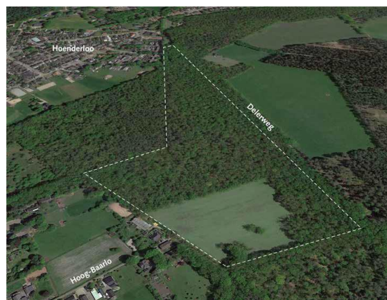
Gebied Delerhoek met het weiland waarop twee landhuizen gepland zijn

Ruim 14 hectare van het bosgebied Delerhoek, ten westen van de Delerweg, is van landgoed Deelerwoud. Ook het weiland aan de zuidkant hoort daarbij. Het is de bedoeling op dat weiland de bouw van twee landhuizen mogelijk te maken. Wanneer dat bestemmingsplan vaststaat zullen de bouw kavels te koop worden aangeboden, elk met circa 7 hectare bos, zodat de terreinen als Natuurschoonwet-landgoederen gerangschikt kunnen worden. Die rangschikking vereist openstelling voor recreatief medegebruik wat bij de overdracht ook notarieel vastgelegd zal worden, zodat iedereen daar kan blijven wandelen.